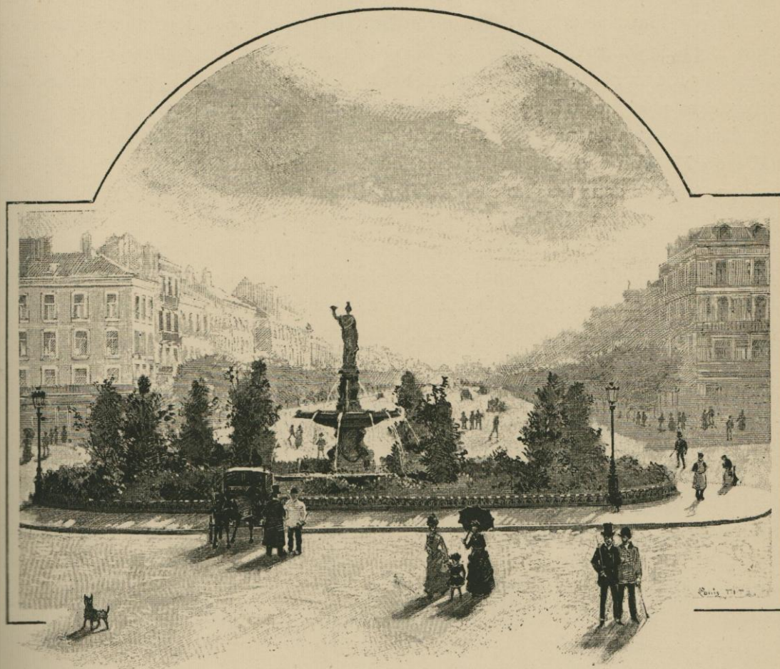
LA PLACE ROUPPE ET L'AVENUE DU MIDI. Dessin de Louis Titz.

accompagné d'une caisse qu'il pose à côté de lui, sous le prétexte que les voyageurs ne payent pas pour le transport des bagages qu'ils prennent avec eux. Après une halte à Vilvorde, le train se remet en marche, avec une violente secousse qui surprend M. Van Pelkom dans une trompeuse sécurité. La caisse dégringole et